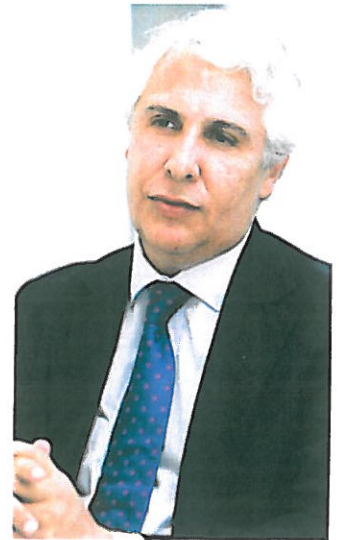
“Penso que a ministra da Justiça tem o mérito de evitar discursos grandiloquentes e de fazer reformas concretas e em campos específicos”